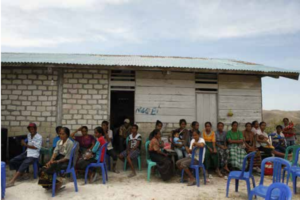
Des personnes issues de régions isolées à Sumba est Ngadulanggi Village