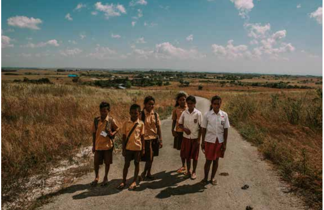
Les enfants rentrant de leur école sans chaussures, Matawai Katingga, Kahaungu Eti, Sumba Est

environnement, qui sont interprétés à travers l'authentique point de vue des enfants.