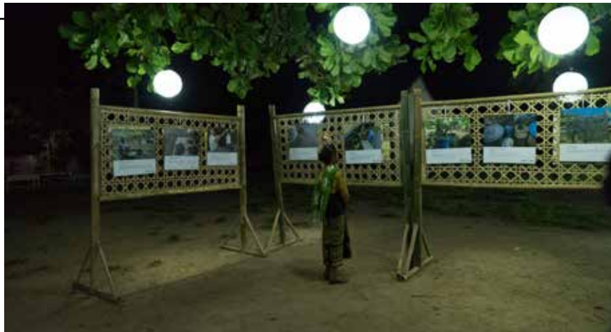
Exemple de concept et réalisation de l'exposition locale