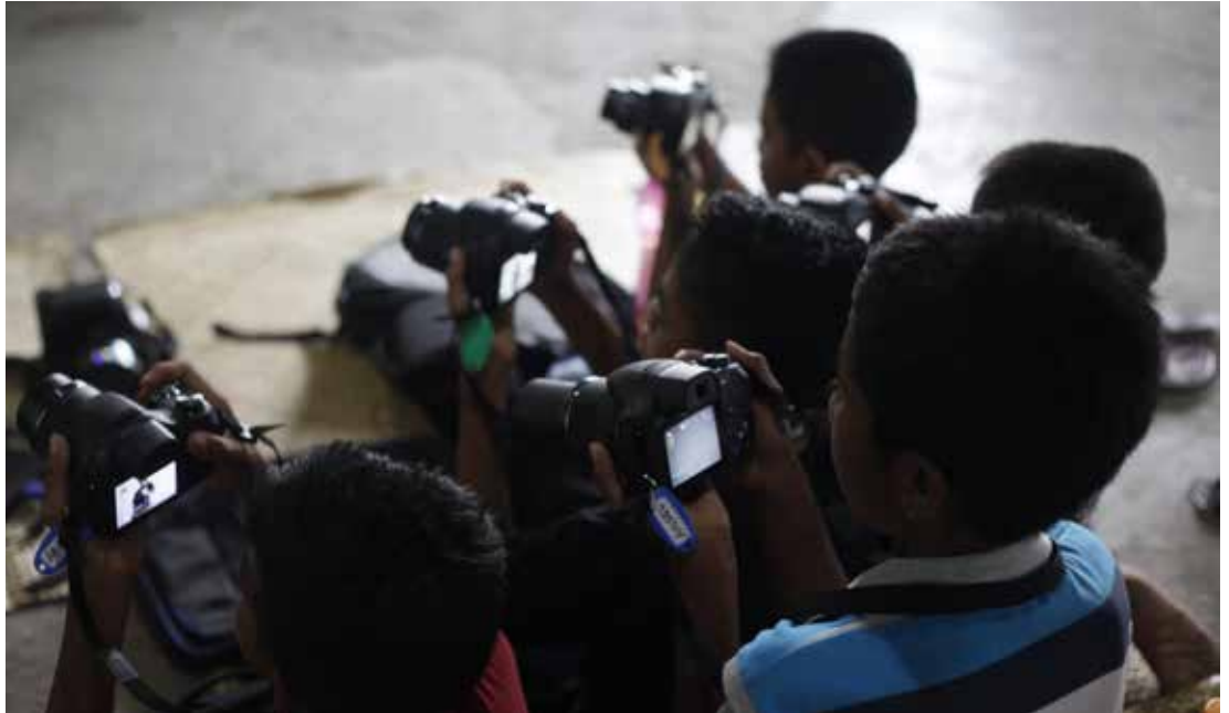
Des enfants apprennent à utiliser un appareil photo | Doc.PhotovoiceSumba by SekarKawung 2017

La réalisation de ce projet présente de nombreux avantages : Premièrement, en participant à ce projet, ils seront encouragés à faire quelque chose de nouveau, qui changera leurs habitudes de tous les jours. Ils vont apprendre et développer de nouvelles compétences. D'un point de vue éducatif, c'est une chance réelle pour eux de progresser.