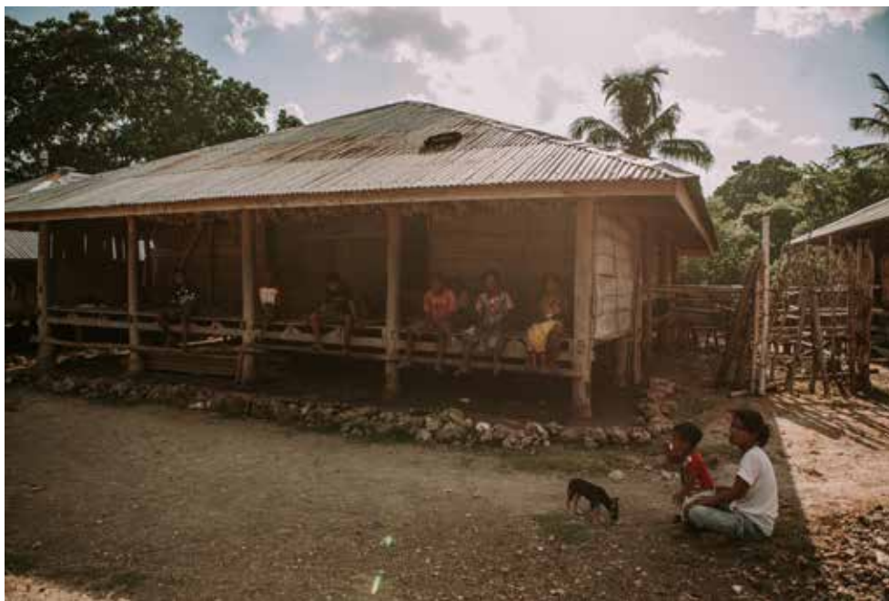
Des personnes issues de régions isolées à Sumba est Lapinu, Matawai Katingga Village